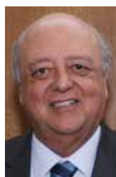
Vice Presidente, José Antonio Viera-Gallo